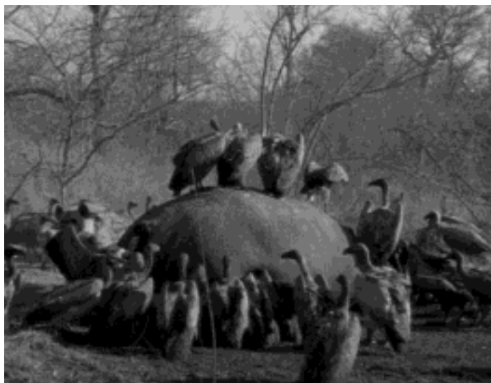
Gieren en hyena's zijn aaseters.