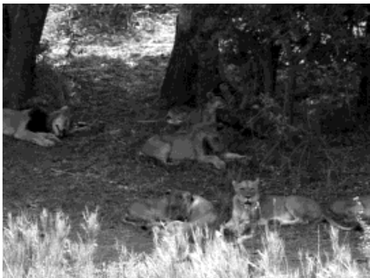
Leeuwen zijn jagers.